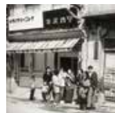
昭和30年代の本店店舗

カバンショップや工房が 達ち並ぶ全長約200m の商店街。通りには全国 でも豊岡にしかないカバ ンの自動販売機が設置 されています。