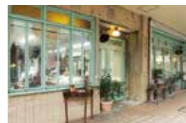
現在の本店舗外観