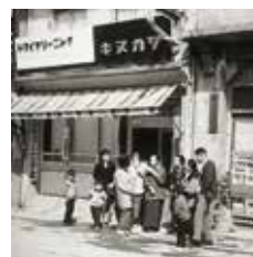
昭和 30 年代の本店店舗

カバンストリート カバンショップや工房が 建ち並ぶ全長約 200m の商店街。通りには全国 でも豊岡にしかないカバ ンの自動販売機が設置 されています。