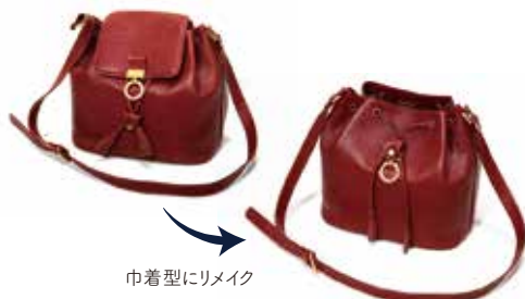
巾着型にリメイク